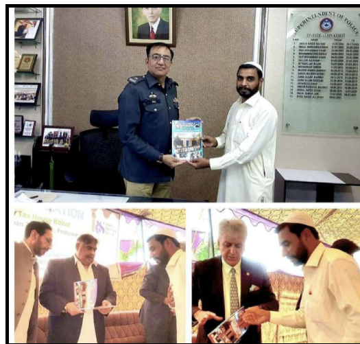
SP آپریشن میگزین کی انڈسٹری سے ملاقات