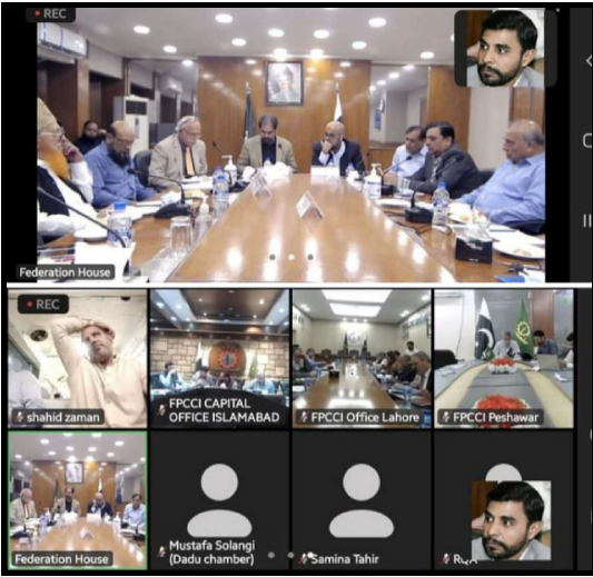
FPCCI آن لائن ویڈیو لنک میٹنگز