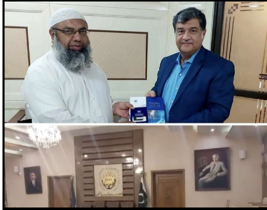
سابق صدر سید فائق شاہ سیالکوٹ چیمبر کا دورہ