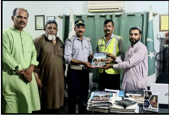
ٹریفک آفیسرز کی کوہاٹ چیمبر آمد