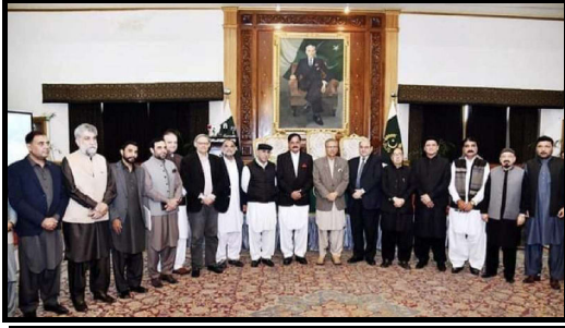
گورنر ہاؤس صدر پاکستان مینٹنگ کے بعد گروپ فوٹو