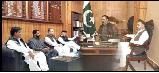
سیکرٹری انڈسٹری ملاقات