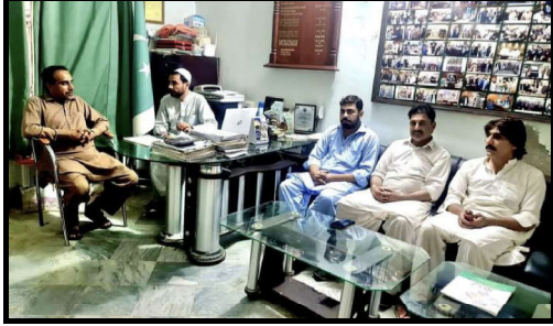
میاں خیل بازار یونین کے عہدیداران سے میٹنگ