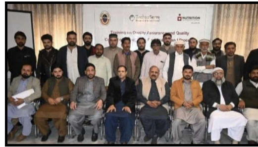
فوڈ سیکورٹی کے حوالہ سے مینٹنگ