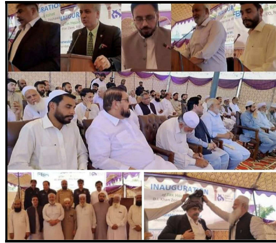
ٹیکس ہاؤس کوہاٹ افتتاح موقع پر