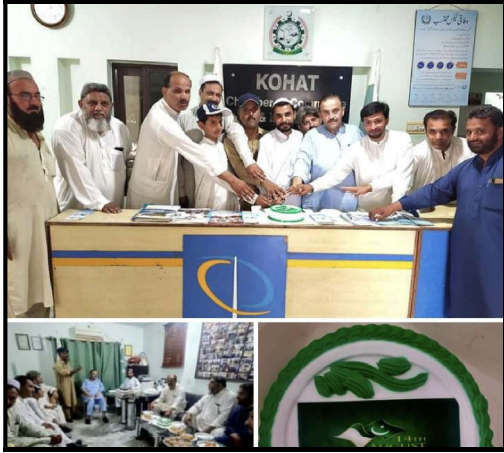
یوم آزادی کے موقع پر