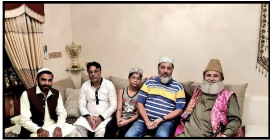
بین بنگلہ دیش کاروباری افراد سے ملاقات