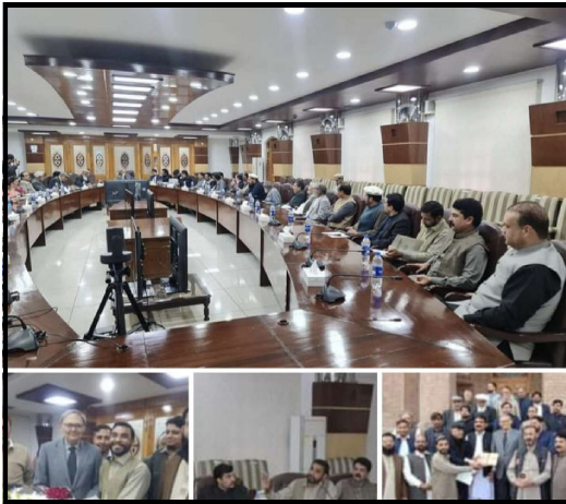
فوڈ سیکورٹی کے حوالہ سے مینٹنگ