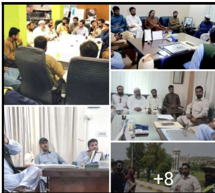
ڈپٹی ڈائریکٹر SIDA DD کے ہمراہ کسٹ یونیورسٹی وزٹ