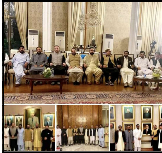
ایکسپورٹ ایوارڈ، ایوان صدر پروگرام میں شرکت