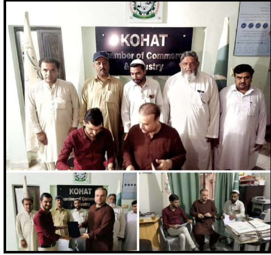
نیشنل اینٹیکو میٹیشن سنٹر سے MOU دستخط