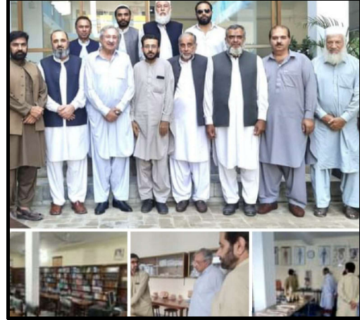
میشنل انسٹیٹیوٹ آف میڈیکل سائنس کا دورہ