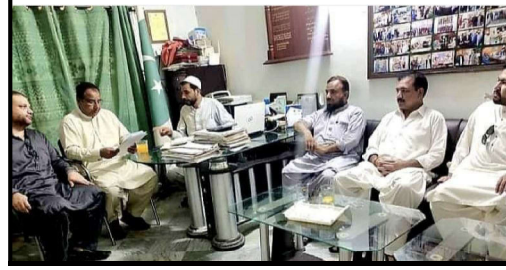
PTI جنرل بیکر نری عامر شاہ چیئر مین وزٹ