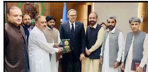
فٹ انڈسٹری مینٹنگ