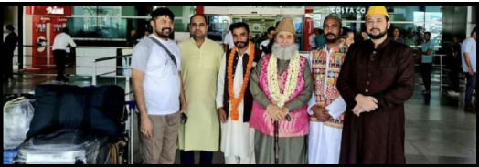
انڈیا دہلی افراد کے طرف استقبال