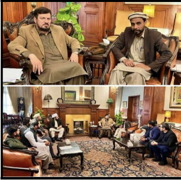
گورنر سے مینٹنگ