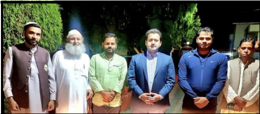
نیپال پاکستانی انجینئری سے ملاقات