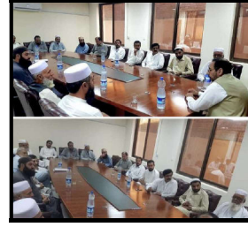
کشمیر FBR سے میٹنگ