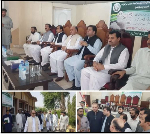
ماحولیاتی آلودگی آگاہی سمینار