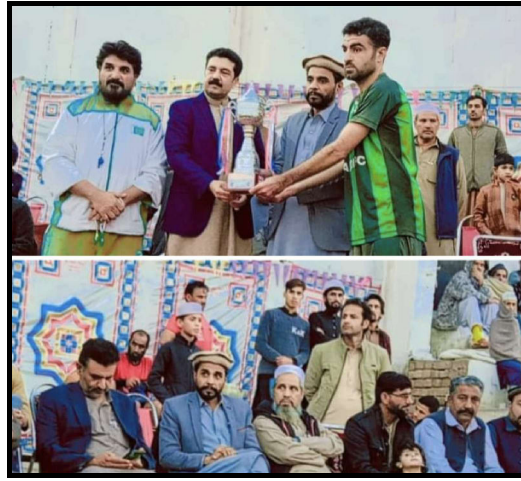
میونسپل گراؤنڈ فٹبال فائنل