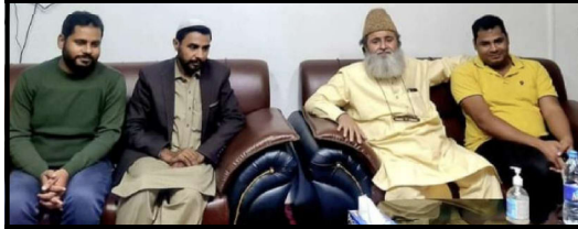
نیپال، کھمنڈو میں وزیر انفراسٹرکچر سے ملاقات