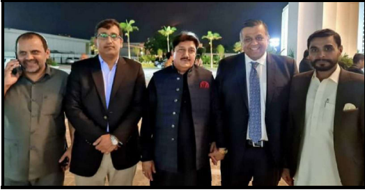
آل پاکستان CNG ایسوسی ایشن سے ملاقات