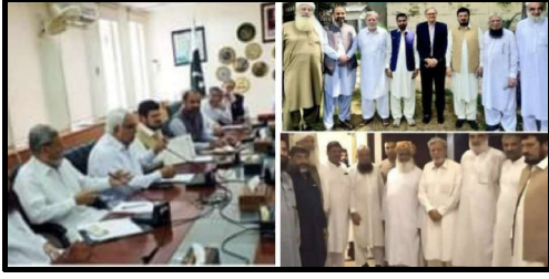
وفاقی وزیر صنعت ٹوید قمر سے ملاقات